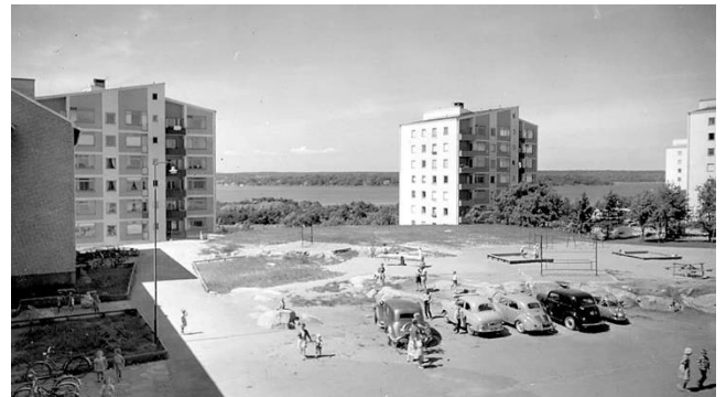
Gammal arkivbild från vår tidiga föreningsperiod

Gatukontoret har dessvärre inte uppfyllt sitt löfte att asfaltera om Arkitektgatan. Men efter ny kontakt med dem igen 31/8 lovade man att asfaltering ska ske 9 – 11 september . Föreningen beror bland annat på pengabrist då det visat sig att den gamla asfalten innehåller tjära och att det då blir dyrare att ta bort densamma än att lägga ny.